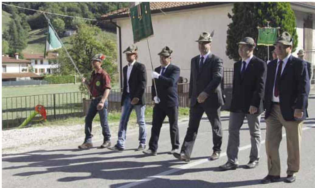
I "pezzi da novanta" aprono la sfilata ...