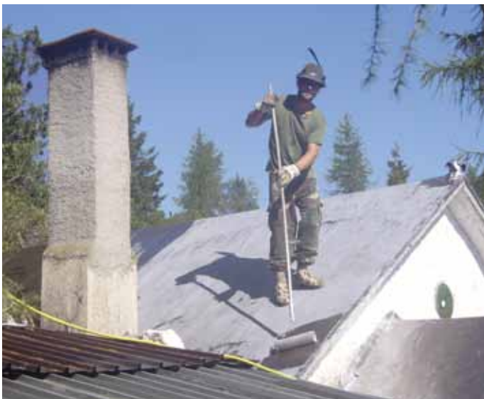
Tofano Nicola - manutenzione