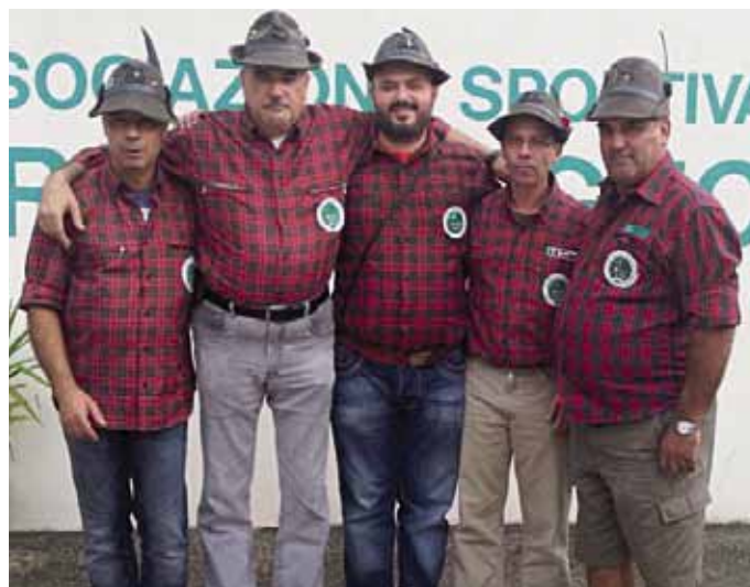
I cecchini di Tarcento