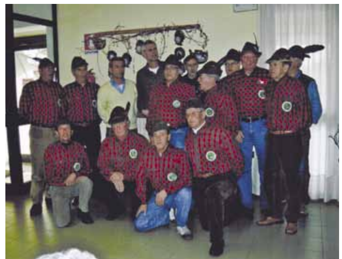
I volontari di Vallonara