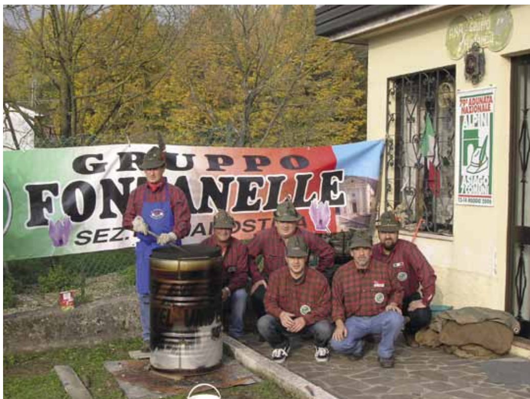
Marronata per tutti!!